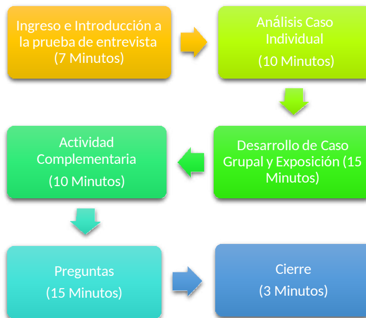
Figura 1. Secuencia de la entrevista

Cada entrevista tendrá una duración mínima de una hora; sin embargo, este tiempo podrá variar teniendo en cuenta la cantidad de aspirantes presentes en la sesión.