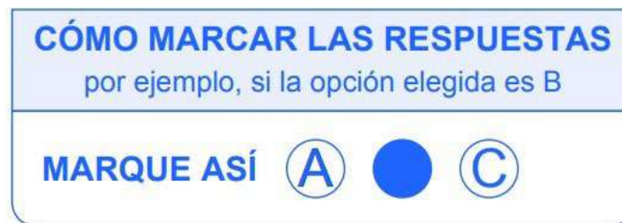
Ilustración 2 Ejemplo de diligenciamiento de respuestas