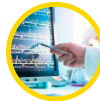
DORADA BIOINFORMÁTICA Y NANOTECNOLOGÍA